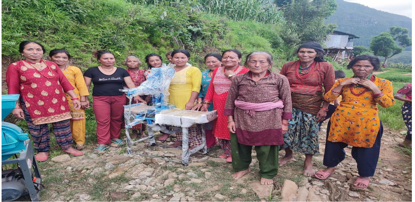
वडा नं ८ मा सिन्के धुप सम्बन्धि व्यवसायीक तालिम लिएका उच्चमीहरुलाई प्रविधि हस्तान्तरण