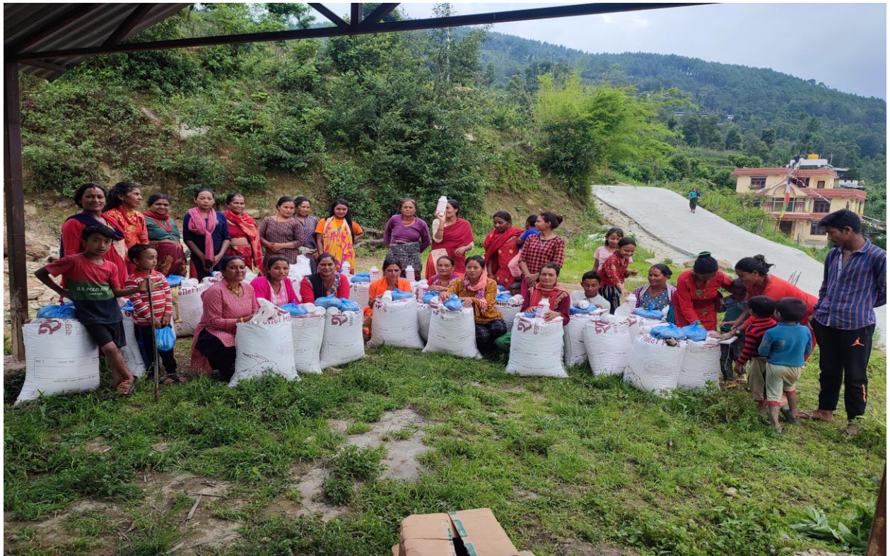
वडा नं १ मा बाखा पालन सम्बन्धि व्यवसायीक तालिम लिएका उच्चमीहरुलाई प्रविधि हस्तान्तरण