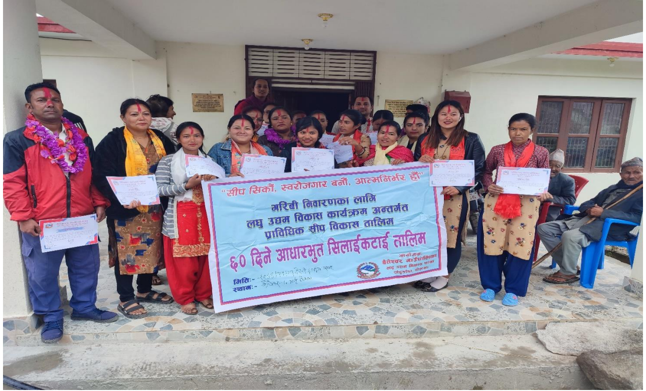
वडा नं ७ मा सिलाई कटाई सम्बन्धि व्यवसायीक तालिम लिएका उद्यमीहरु