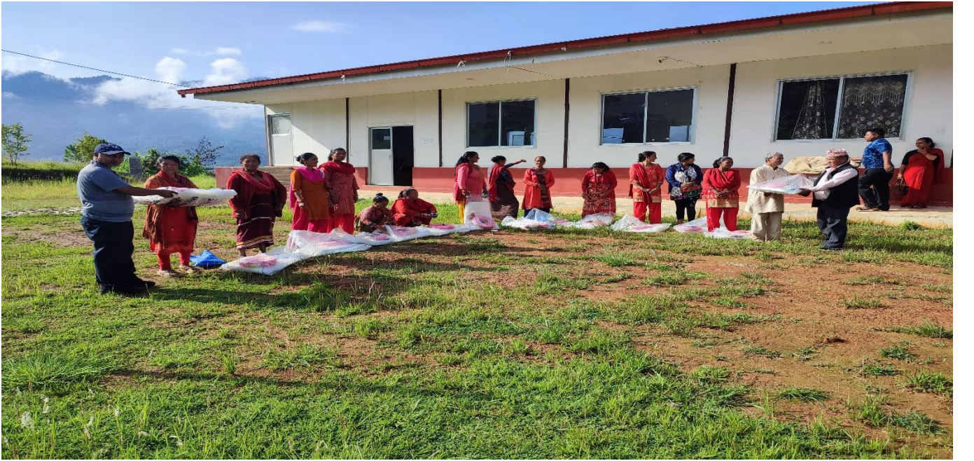
वडा नं ६ मा तरकारी खेति सम्बन्धि व्यवसायीक तालिम लिएका उच्चमीहरु