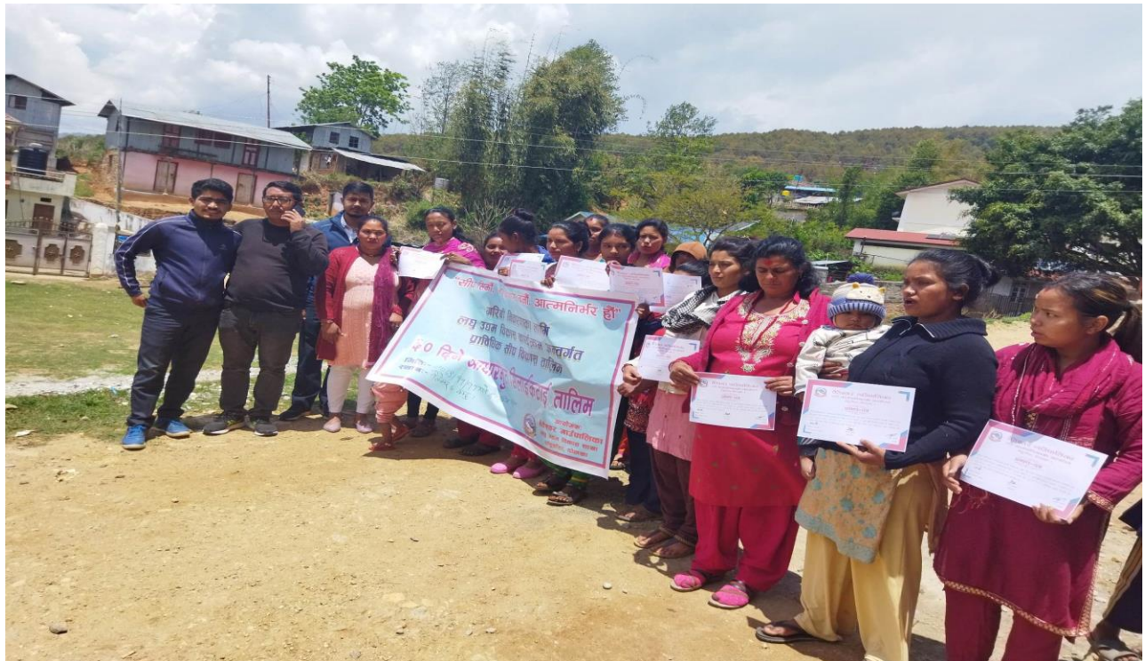
वडा नं ६ मा सिलाई कटाई सम्बन्धि व्यवसायीक तालिम लिएका उद्यमीहरु