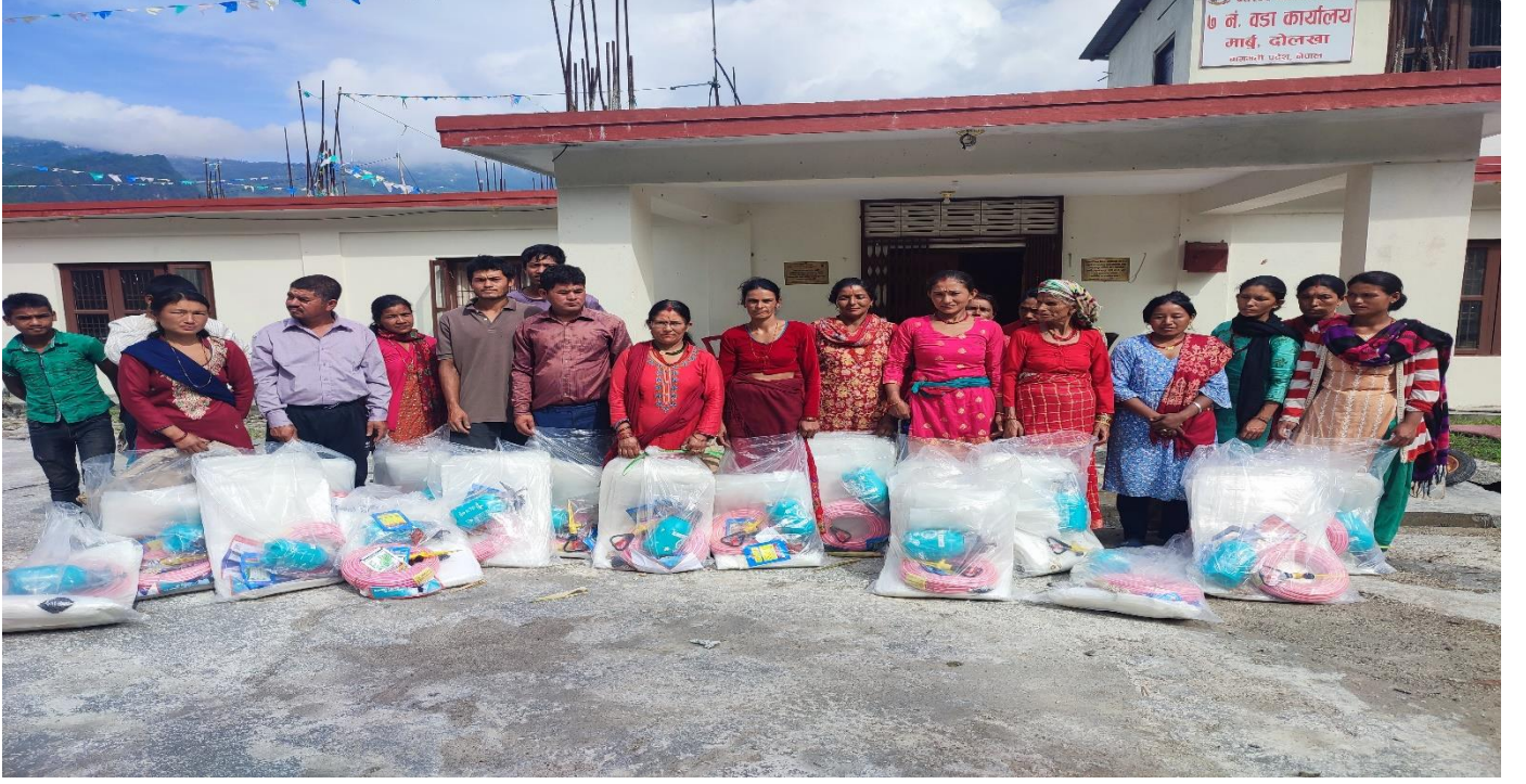
वडा नं ७ मा तरकारी खेति सम्बन्धि व्यवसायीक तालिम लिएका उच्चमीहरु