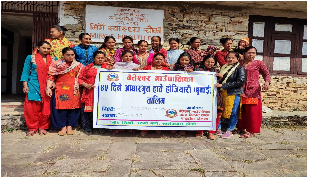
वडा नं ३ मा हाते होजियारी बुनाई सम्बन्धि व्यवसायीक तालिम लिएका उद्यमीहरु