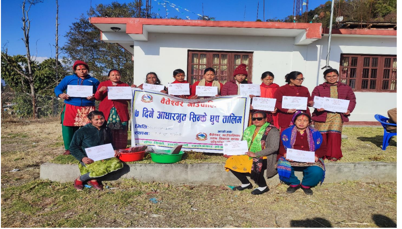
वडा नं ८ मा सिक्के धुप (अगरबत्ती) सम्बन्धि व्यवसायीक तालिम लिएका उद्यमीहरु