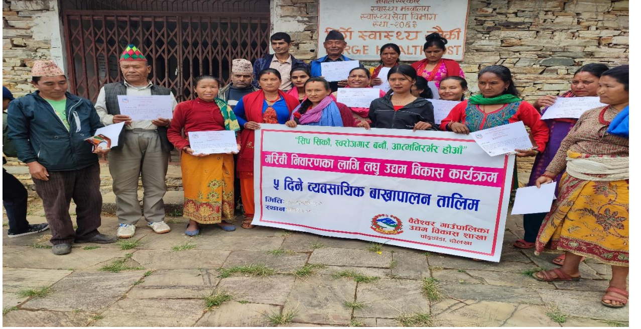
वडा नं ३ मा बाखा पालन सम्बन्धि व्यवसायीक तालिम लिएका उद्यमीहरु